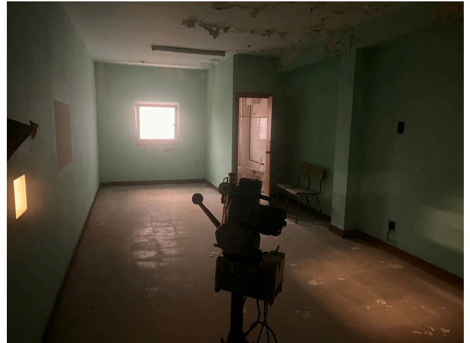
Sala de proxeccións

O campo de herba xa comezou a ser utilizado polo equipo ferrolano de rugby. Cun adecuado tratamento, permitiría ao barrio de dispoñer dun campo de herba onde competir.