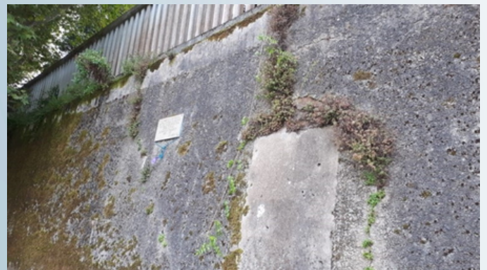
Muro do antigo cemiterio de Canido.

Lugares de soterramento de vítimas da represión en fosas comúns: cemiterio municipal de Canido (máis de trescentos soterrados pola represión entre 1936 e 1945) e parroquial de Serantes (170). Lugares onde se rememora a memoria de personaxes nados neste contorno que defenderon os dereitos democráticos e sociais: a alameda do Cantón, a avenida do mestre García Niebla e as casas de Concepción Arenal e Carvalho Calero.