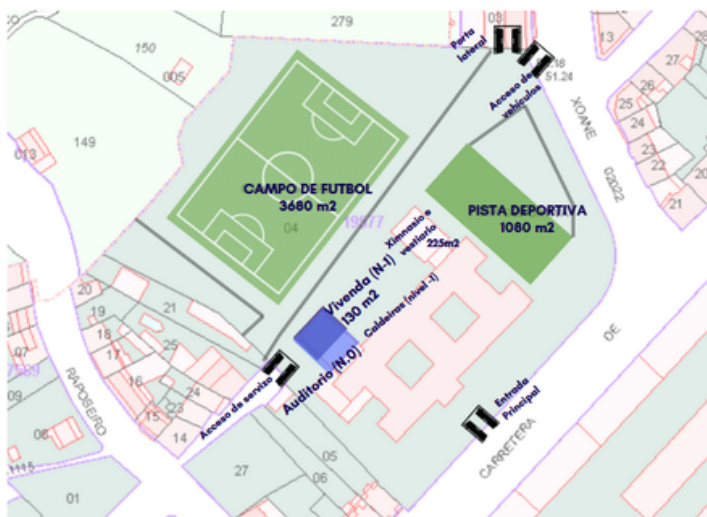
Esquema de espazos e accesos.2025, Intrabarrrial de Canido.

Unha necesaria intervención da administración permitiría a apertura deste amplo espazo ao barrio e á convivencia de usos educativos e para as entidades da zona. En O Barrio, informaremos puntualmente do avance desta iniciativa.