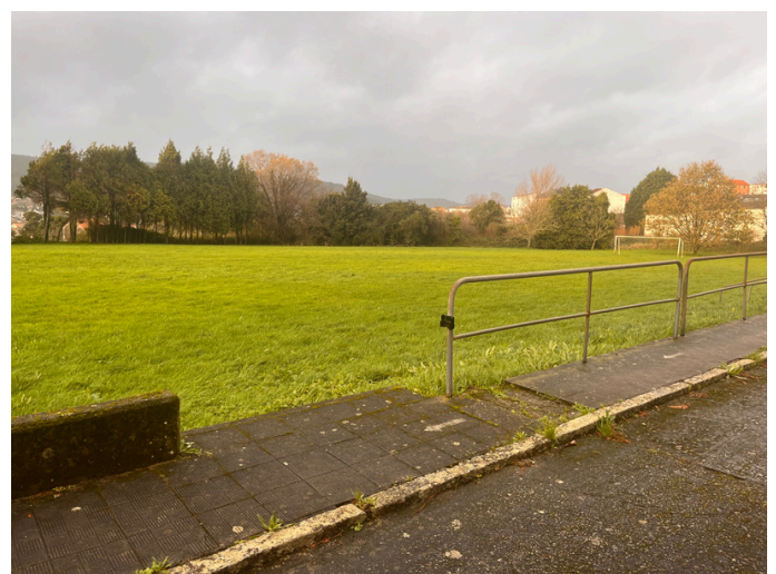
Campo de herba

A intrabarrrial, da man da Directiva do CEIP, buscará a rehabilitación do auditorio e os espazos deportivos do centro, para poñelos a disposición do propio centro e do barrio.