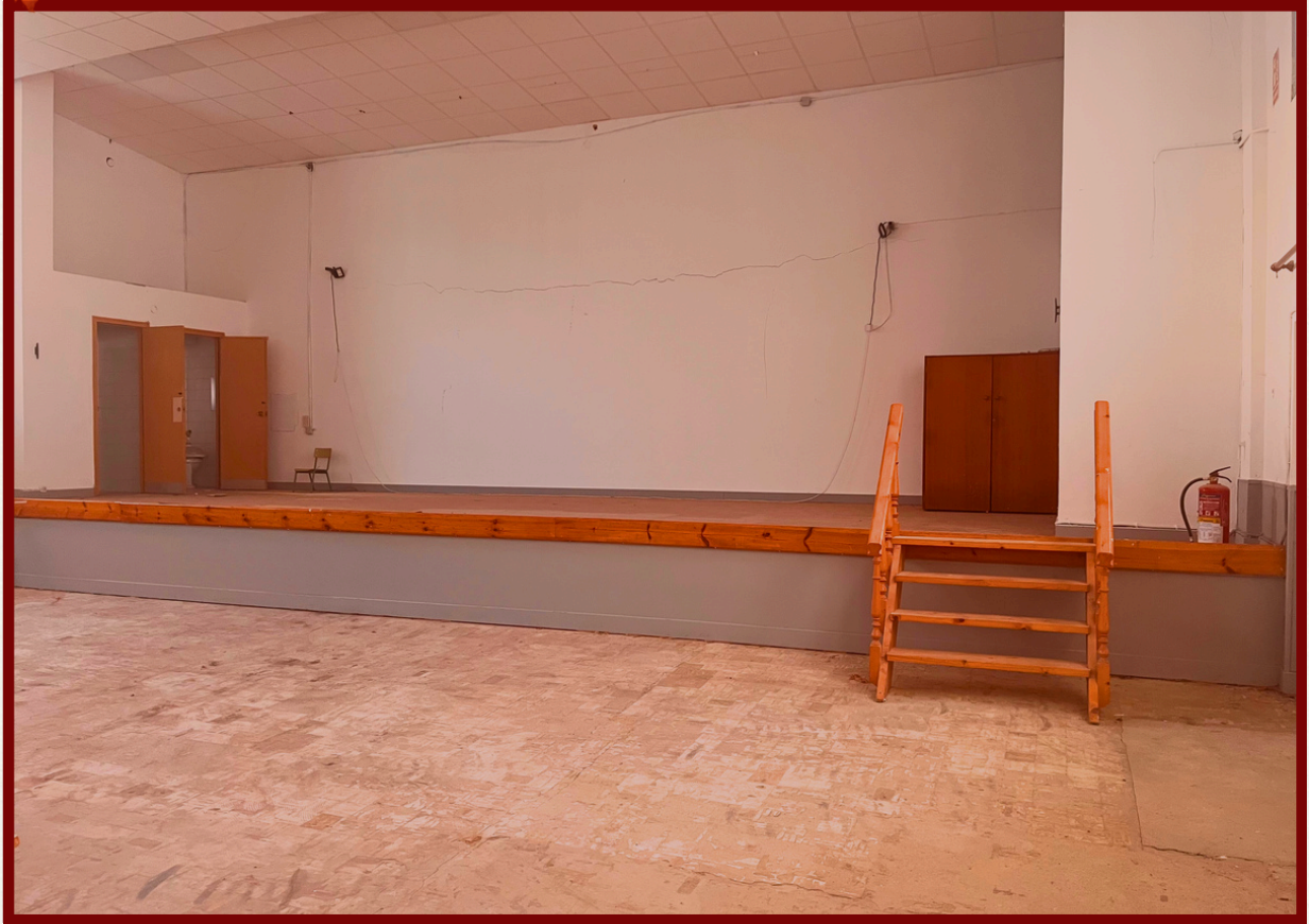
Instalacións do auditorio do colexio CEIP Juan de Lángara.

BOLETÍN INFORMATIVO PARA A VECIÑANZA DE CANIDO