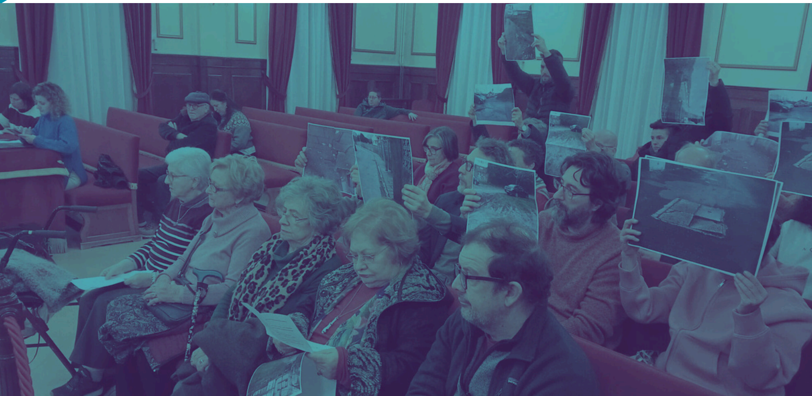
Veciñanza de Canido presente no Pleno Municipal do 12.01.2025

O pasado 12 de xaneiro unha representación da INTRABARRIAL de Canido asistiu ao Pleno do Concello de Ferrol no que se aprobaron os Orzamentos Municipais de 2025, negándose as alegacións feitas dende o barrio nas que se amosaba o noso malestar pola falta de investimentos urxentes , dadas as necesidades tan evidentes como que é difícil transitar por algunhas rúas sen risco de accidentes. Os medios de comunicación recolleron amplamente a nosa campaña de información e de reclamacións.