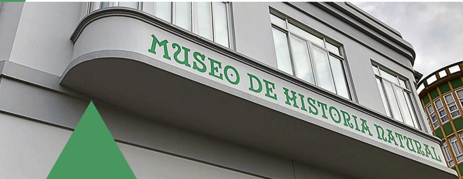
Fachada no museo da SGHN na antiga “Casa do Coronel”, na Plaza de Canido

Sabías que o barrio alberga dende hai 14 anos o museo máis completo de Galicia adicado á historia natural? Trátase do Museo da Sociedade Galega de Historia Natural (MHNF), que naceu no seo desta institución, creada no ano 1976 como entidade científica sen ánimo de lucro e de carácter independente, a partir do GOG (Grupo Ornitolóxico Galego, 1973).