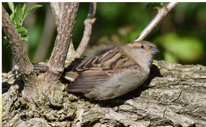
Pardal femia. Fonte de Insua

común en España descendeu case un 20% dende que se comezou a rexistrar datos en 1998 . As causas deste declive permanecen sen ser identificadas con seguridade, pero se constatou que o descenso é máis acusado nos medios urbanos que nos contornos rurais. Un estudo recente elaborado por investigadores españois examinou se o cambio da dieta humana e a irrupción da “comida lixo” podería ser unha das causas do declive dos pardais. O informe concluíu que, efectivamente, o costume de aproveitar os nosos restos de comida afecta negativamente á saúde destas aves e que os pardais expostos a estas dietas sofren carencias. Por sorte podemos dicir que o barrio de Canido aínda conta cunha boa poboación de pardais , e non é raro, paseando polas zonas máis verdes, atopar bandos destes buliciosos paxaros, ás veces de varias ducias. Será que en Canido aínda non se impuxo a comida lixo.