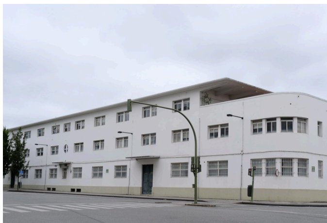
O edificio de Suboficiais

Outro proxecto xa aprobado é a adquisición do edificio de Suboficiais, na Praza de Canido/rúa Alegre, que ben empregado poñería ao barrio na vangarda de equipamentos para o uso público, ampliando a función tan importante que realiza nese lugar ASPANEPS (Asociación de Pais e Nenos con Problemas Psicosociais). Tampouco hai partida orzamentaria para outro proxecto xa aprobado en Pleno, a realización do estudo sobre a vivenda, que sería a base para a toma de decisións sobre a súa regulación na nosa cidade, sendo un problema este cada vez máis urxente.