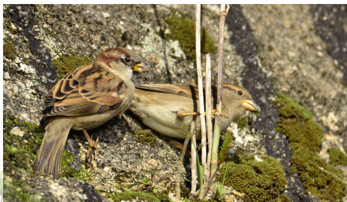
Pardais, macho e femia, A Malata

É fácil distinguir a machos de femias. Os machos locen píleo gris, anteface negro, peteiro negro (na época de celo) e un babeiro negro moteado que se vai facendo máis grande coa idade. As femias teñen o píleo marrón, unha liña clara tras o ollo, ausencia de babeiro e peteiro de cor gris e amarelento. Non se libra esta especie da tendencia xeral que afecta negativamente ás nosas aves, en xeral. O pardal