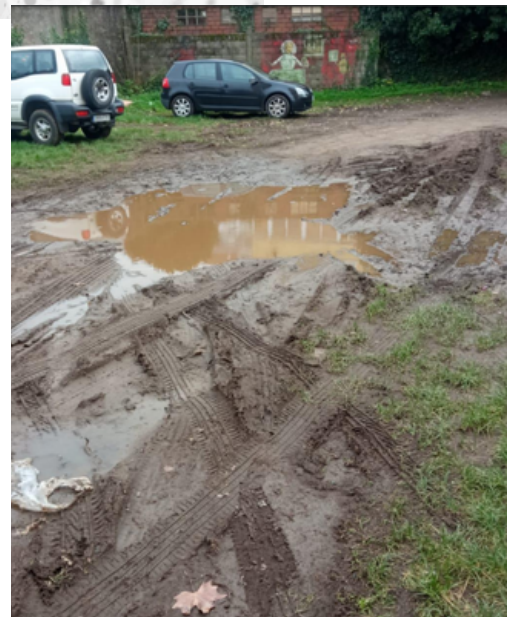
Estado do firme na zona de Muíño do Vento

Foi unha iniciativa veciñal e recollida tamén como propia por parte da veciñanza de Canido, o establecemento de medios mecánicos para subir as empinadas rúas que unen a Magdalena e Ferrol Vello con Canido. Ferrol non pode estar “aberto ao mar” se os nosos maiores ou a poboación con dificultades de mobilidade non poden achegarse a el. Dentro da mesma iniciativa “Unir Ferrol ao mar” tería cabida a humanización da rúa Celso Emilio Ferreiro.