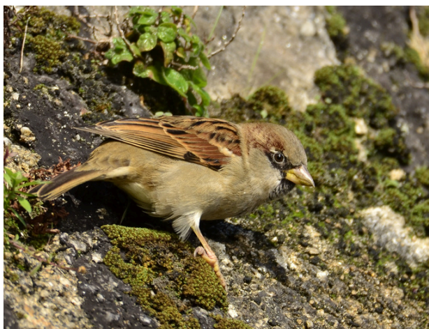
Pardal macho. A Malata

Hai animais que están asociados de maneira intrínseca á actividade humana, vivindo canda nós nas nosas aldeas, vilas, cidades e labradíos. Un deles é o pardal común , unha pequena ave que viste un bonito traxe de cores terrosas, grises e brancos que practicamente todos recoñecemos ao instante. Son os nosos compañeiros de rúa, de fiestras, de parques e incluso de terrazas de bar. O seu nome científico, Passer domesticus , xa nos dá unha pista das súas preferencias. Tan afeitos están a nós, que cando un casal queda baleiro, eles tamén desaparecen xunto cos humanos.