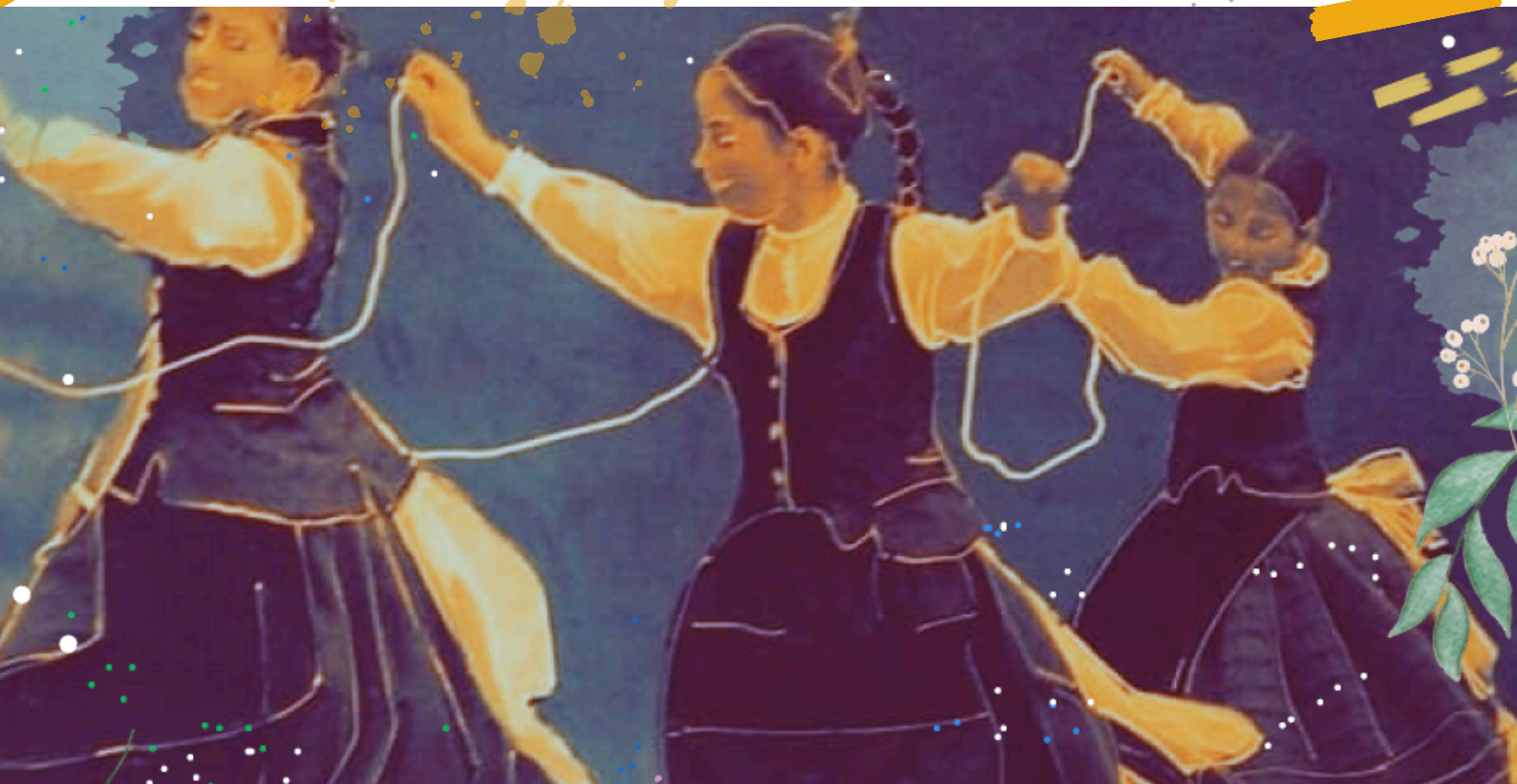
Fragmento do cartel dos Maíos 2025 (María Méndez)

BOLETÍN INFORMATIVO PARA A VECIÑANZA DE CANIDO