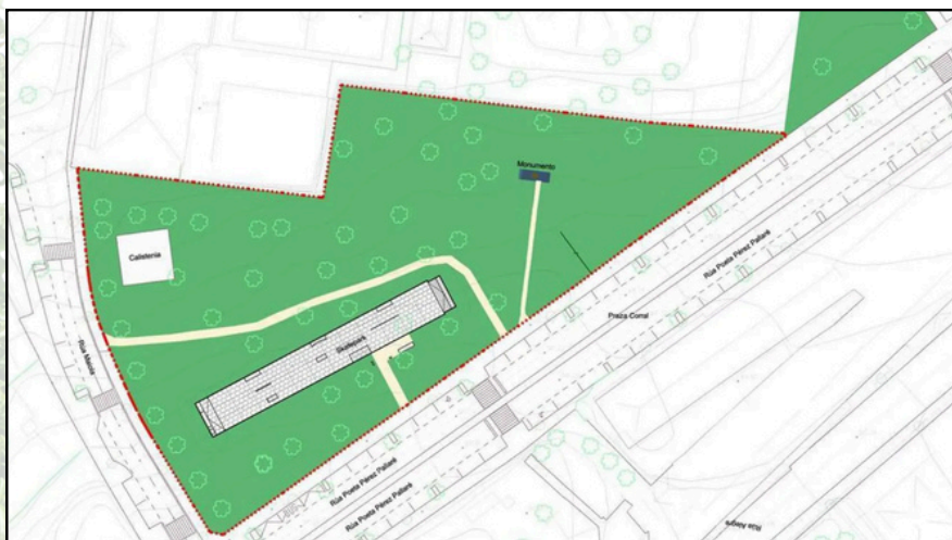
Proxecto inicial para a o skatepark no parque Antón Varela

A finais de 2024 o Concello de Ferrol adxudicou un proxecto para a construción dun skatepark no parque Antón Varela. Tras escoitar ás partes interesadas, a AV Canido propuxo ao Concello unha proposta de modificación, co ánimo de garantir a compatibilidade dos distintos usos para o parque.