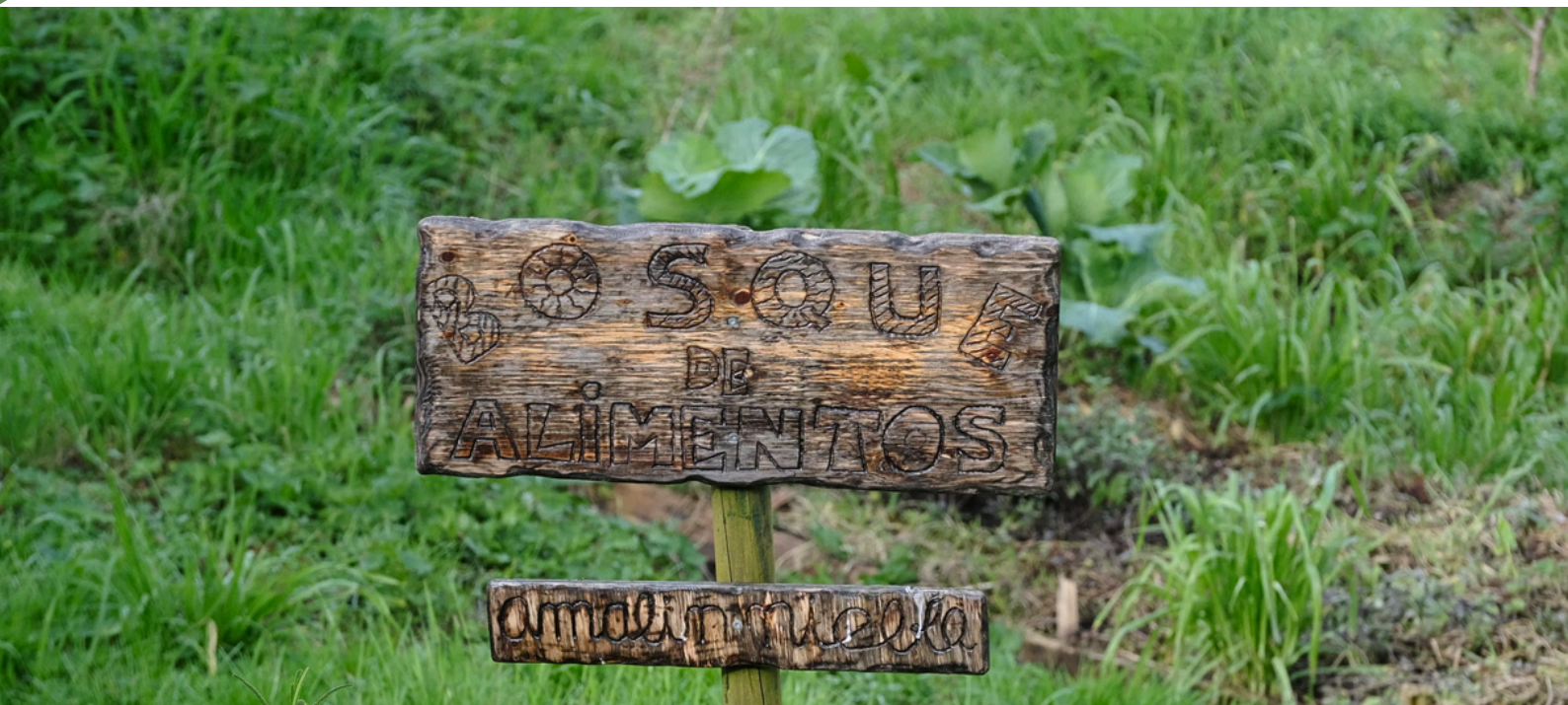
Letreiro indicativo na parcela cedida por Amalín Niebla

BOLETÍN INFORMATIVO PARA A VECIÑANZA DE CANIDO