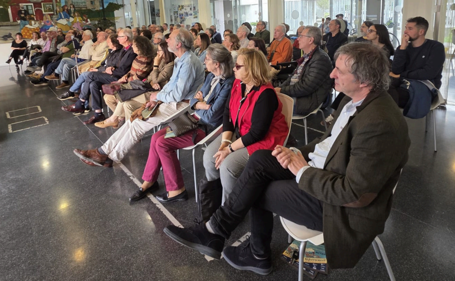
Imaxe dunha das conferencias do ciclo, celebrada no Centro Cívico