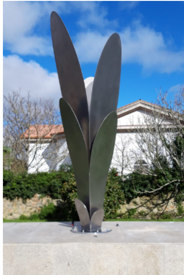
O memorial foi inaugurado o 24 de febreiro nun evento organizado polo Concello de Ferrol.

En Ferrol non houbo guerra, tan so unha heroica pero breve resistencia militar e cidadá ao Golpe de Estado, mais a represión golpeou con dureza extrema na comarca. Foi o antigo Cemiterio, agora o terreo do IES Canido, un lugar de fusilamentos e de aí a relevancia de significar este lugar como espazo para a memoria.